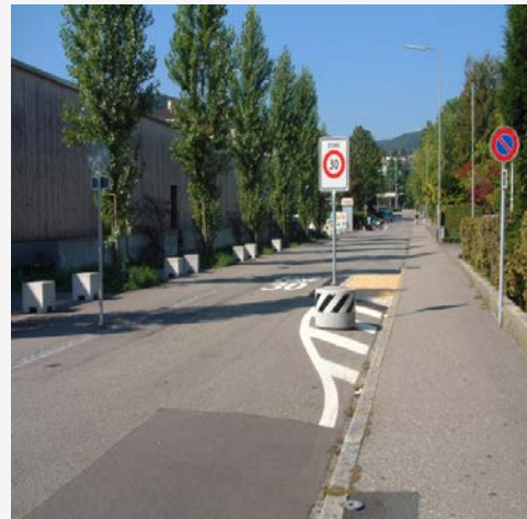
Signal mit Konstruktion und Poller