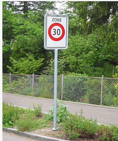
Signal mit Mast